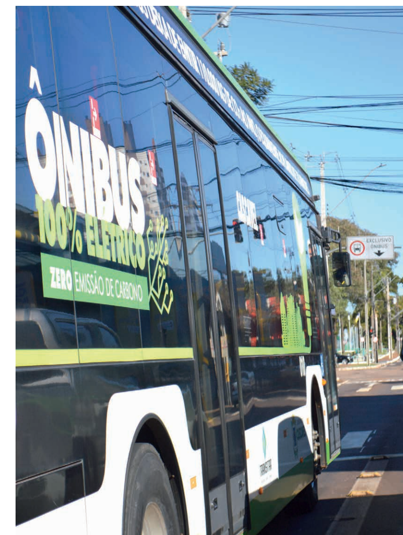
Durante vigência na nova prorrogação do contrato a promessa é que tarifa não terá reajuste; sistema também não terá mudanças

Também permanecem no projeto os 15 ônibus elétricos pertencentes ao município. Nesse formato, as empresas fornecem motoristas e operação, enquanto a Prefeitura assume despesas relacionadas à manutenção, pneus e estrutura dos veículos.