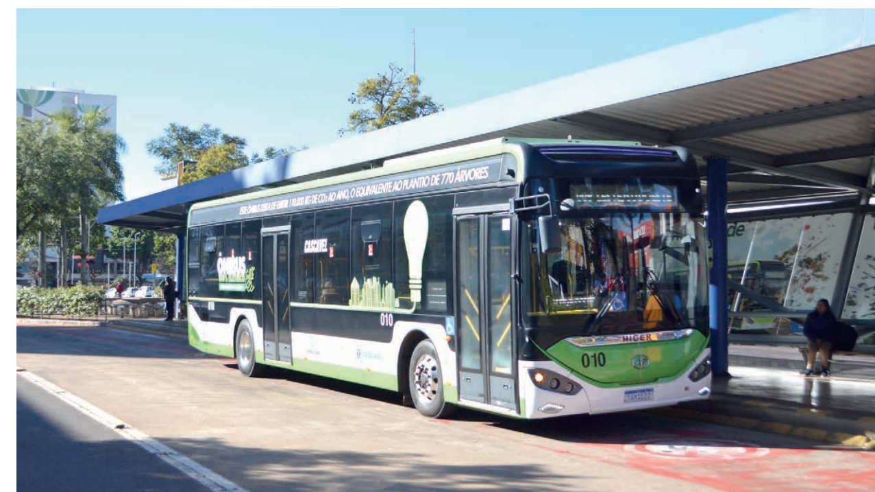
Serviços do transporte coletivo urbano de Cascavel seguem funcionando há cinco anos com contratos prorrogados

De fato, a sanção veio acompanhada de vetos que frustraram parte do setor. O governo derrubou, entre outros pontos, a obrigatoriedade de estados e municípios custearem integralmente gratuidades e descontos, a previsão de subsídios federais obrigatórios para tarifas locais, a isenção de pedágio para ônibus e a destinação obrigatória de parte dos recursos da Cide ao transporte urbano.