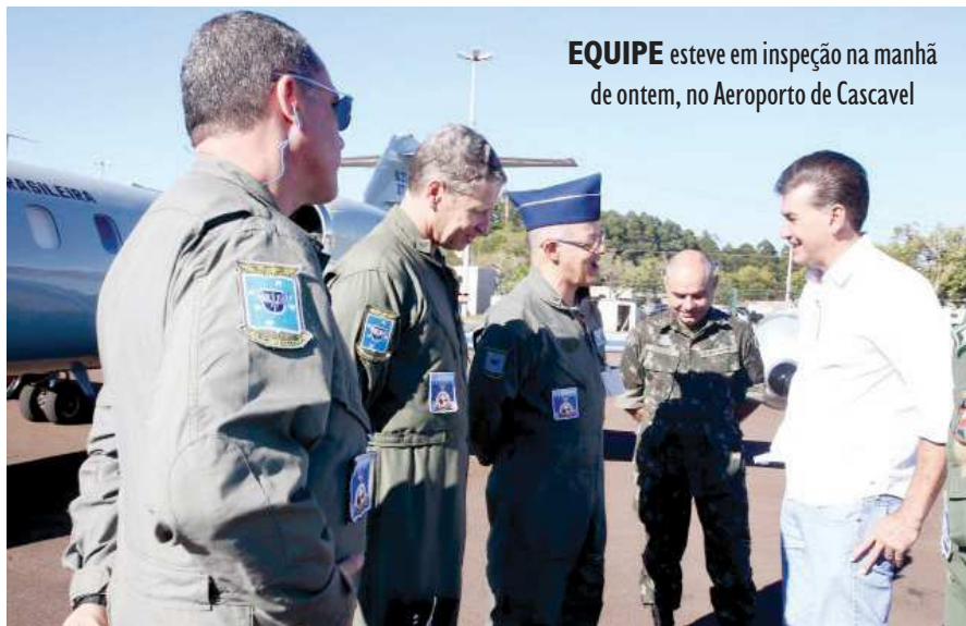
EQUIPE esteve em inspeção na manhã de ontem, no Aeroporto de Cascavel

Em Cascavel, são 80 militares, além de aeronaves: três caças Tucano e um helicóptero. A cidade é considerada pela Força Aérea ponto estratégico para a operação, que segue até dezembro, com bases montadas em toda a faixa de fronteira.