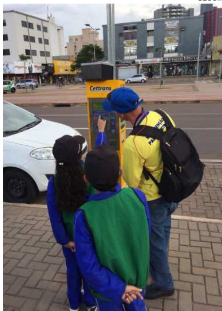
AS crianças ajudaram até a manusear o parquímetro