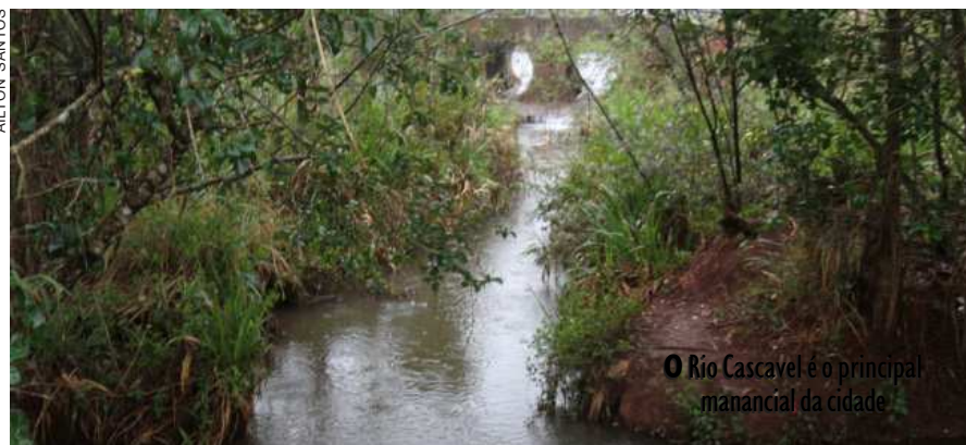
O Rio Cascavel é o principal manancial da cidade

Em paralelo, será feito novo diagnóstico de campo, levantamento de áreas de vulnerabilidade ambiental,