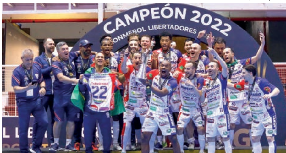
Cascavel Futsal vence a Libertadores da América de forma inédita

Com o título continental, o Cascavel garantiu vaga no Mundial de