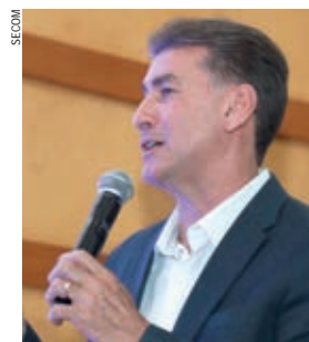
Leonardo Paranhos, prefeito de Cascavel sobre crescimento do PIB municipal, colocando a cidade como 80ª maior economia do Brasil

“A cidade tem vocação para o empreendedorismo e as ferramentas criadas pelo poder público desburocratizaram os processos para aqueles que pretendem investir aqui e gerar emprego e renda”