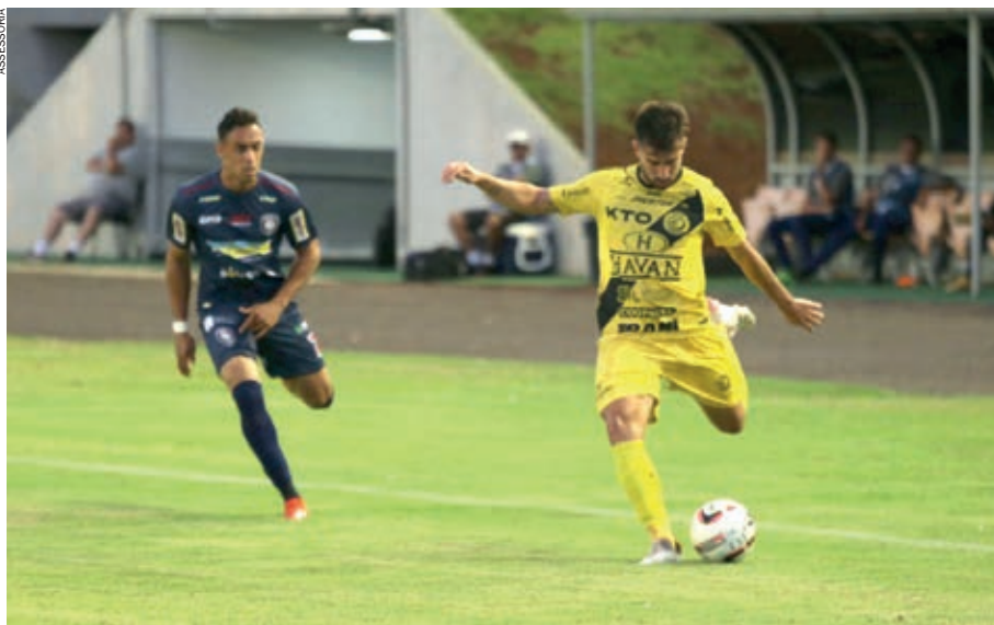
NO PRIMEIRO duelo entre os times, o placar não saiu do zero

Depois de encarar o Cianorte, o FC Cascavel volta a jogar em casa na última rodada do torneio. No dia 8 de janeiro, a Serpente recebe o Maringá, no Estádio Olímpico Regional.