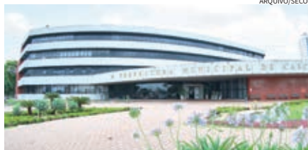
Definição da disputa pelo comando da Prefeitura de Cascavel começa entrar na reta final

Em Cascavel, com todos os pré-candidatos já conhecidos, as convenções estão praticamente definidas. O PP do deputado Marcio Pacheco faz sua convenção no dia