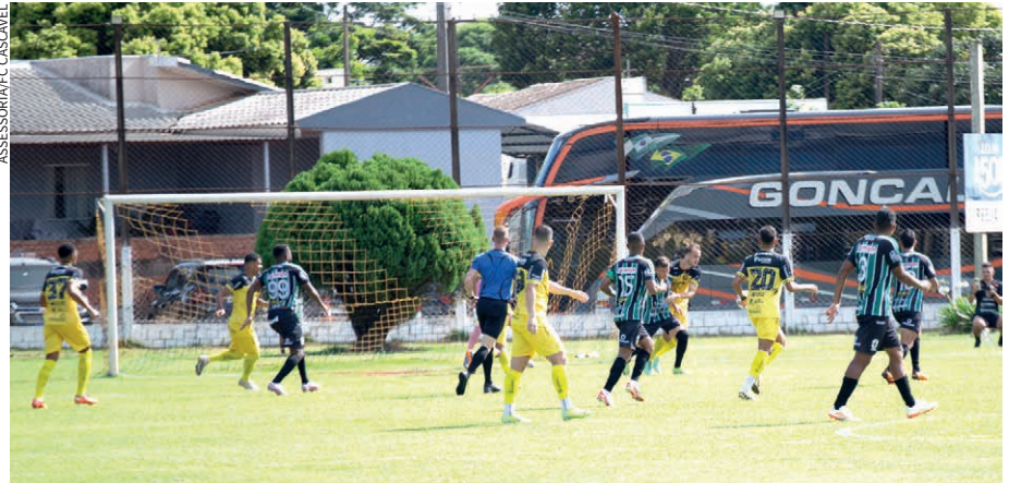
Em duelo recente, no Torneio de Verão, o Maringá derrotou o FC Cascavel por 2 a 0

A polêmica da rodada aconteceu no jogo da Serpente, contra o Paraná Clube, na quarta-feira (29). O time da capital fez seis substituições durante o jogo, sendo que o máximo permitido