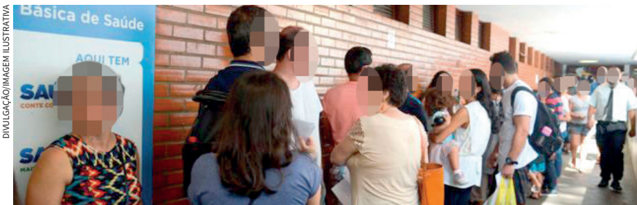
Falta de informação sobre fila de espera deixa a situação dos pacientes ainda mais delicada

Se toda fila pública pudesse ser resolvida assim, com cartas – ou melhor, senhas – que saem da manga... Mas, infelizmente, a mágica não faz parte do dia a dia de quem espera na fila por uma cirurgia eletiva em Cascavel e região. Ainda mais por se tratar de uma fila virtual, onde não é possível fazer coro e