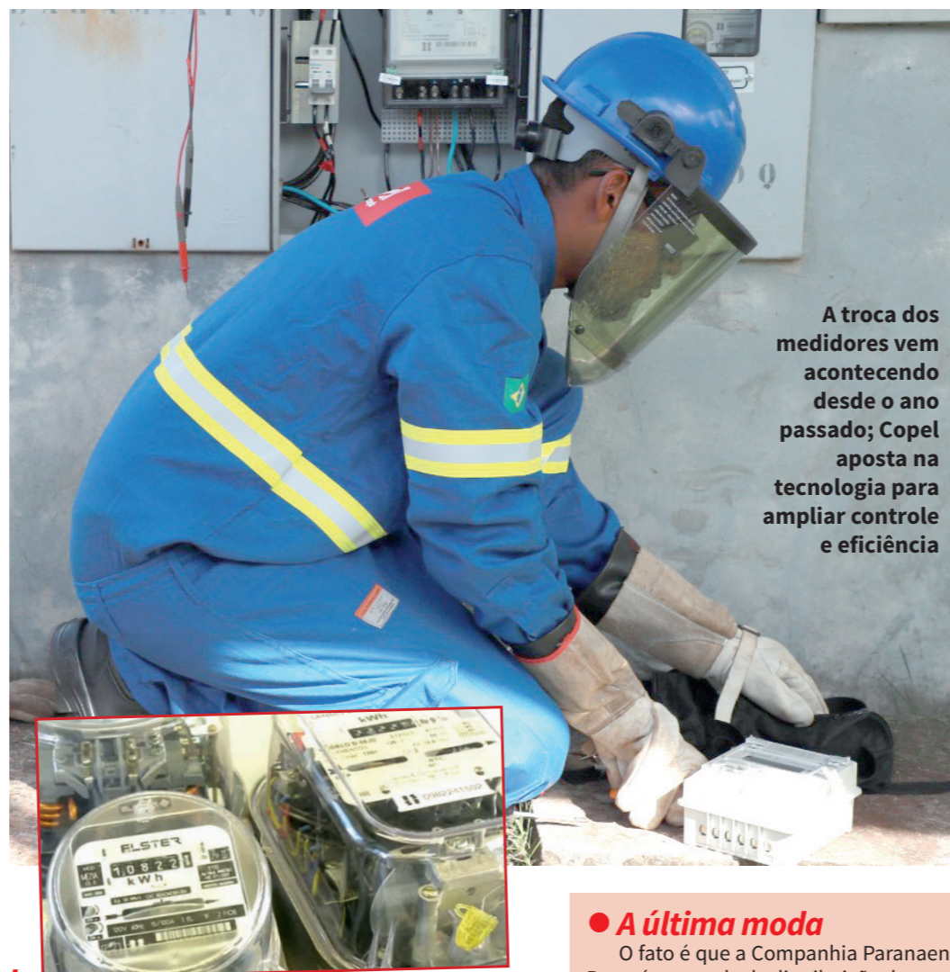
A troca dos medidores vem acontecendo desde o ano passado; Copel aposta na tecnologia para ampliar controle e eficiência

Entre as publicações sobre o assunto, são poucas as que reconhecem algum benefício do equipamento. Mais fácil é ouvir o amigo do vizinho do cunhado do primo relatando que com o medidor inteligente a conta de luz baixou. Até a redação do Hoje Express chegaram casos de diminuição dos valores, como o relato de um dos diretores: “Pra mim a conta baixou 30% pelo menos, no meu pai baixou, lá na casa da minha madrastra baixou, no meu vizinho baixou, para todo mundo que eu conversei, pra todo mundo baixou a conta”.