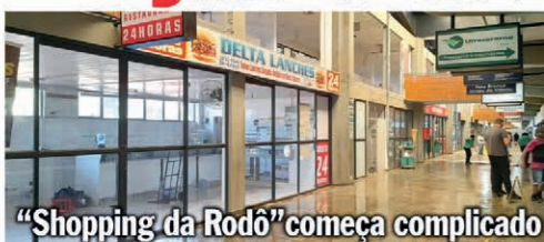
Falar em Shopping Center em Cascavel é sempre complicado. Primeiro foi Cascavel Golden Shopping que ficou tempo abandonado até virar o “A”. Depois a novela do Catual, enfim, sendo concretizada. Agora, a reforma da Rodoviária de Cascavel, que está sendo totalmente revitalizada e modernizada, deixou a situação dos comerciantes do terminal, que já era difícil, um pouco pior. E como diz o conhecido cântico: “E pau, é pedra é a fim do caminho”. Páginas 4 e 5