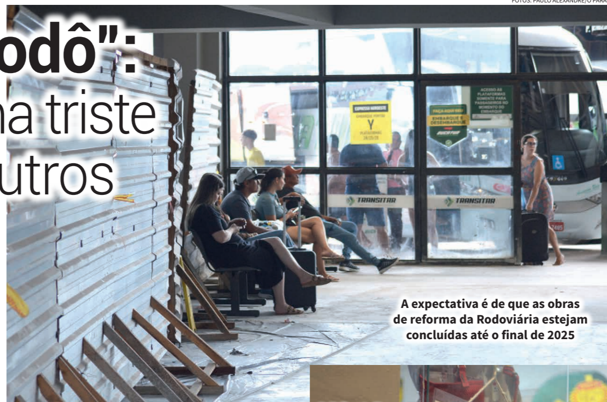
A expectativa é de que as obras de reforma da Rodoviária estejam concluídas até o final de 2025

“Todos os dias é um vai e vem, a vida se repete na estação”, diz a triste melodia que – não por acaso – servirá de trilha sonora para o especial desta semana do Hoje Express : É triste a despedida dos comerciantes que ocupam há décadas as ‘lojinhas’ do Terminal Rodoviário Dra. Helenise Pereira Tolentino.