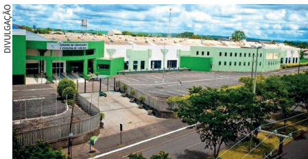
A atual estrutura do Centro de Convenções e Eventos foi inaugurada no ano de 2000