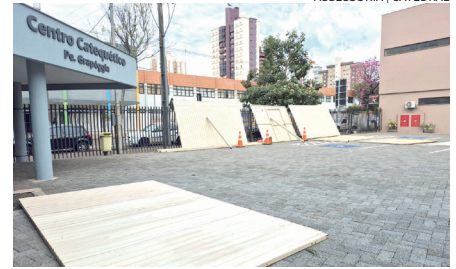
ASSESSORIA | CATEDRAL

A montagem das barracas ao redor da Catedral começou nesta semana e a programação deste ano terá dois dias a mais de duração em relação aos anos anteriores: as barracas funcionarão de 3 a 12 de outubro. A festa deve superar a marca de 100 mil pessoas. Além da praça gastronômica, a programação reúne momentos religiosos, culturais e de fé, que incluem novenas, missas, a carreata e a motociata da fé, além da missa de envio e da recepção dos romeiros de Aparecida do Norte.