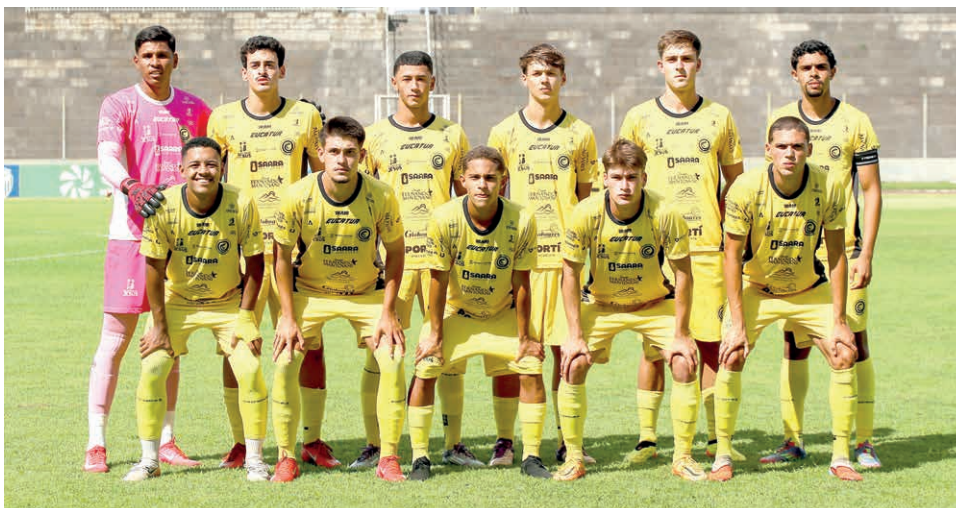
ASSESSORIA FC CASCAVEL

O início promissor dos “Piás do Ninho” coloca novamente a equipe como uma das candidatas a chegar à fase final da competição e, quem sabe, a conquistar o título inédito.