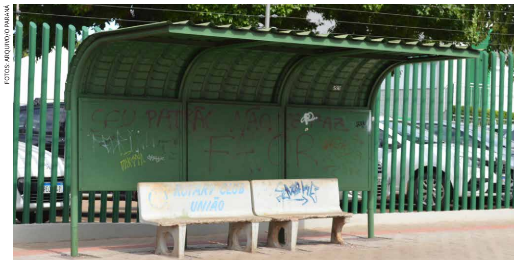
Em vias já revitalizadas abrigos antigos aguardam substituição, mas ainda protegem o usuário, diferente das dezenas de pontos sem qualquer estrutura

No fim das contas, entre abrigos que não chegam e licitações que não saem, o transporte público de Cascavel continua sendo uma história “estacionada” e, ao que tudo indica, ainda longe da grande movimentação para o esperado último capítulo.