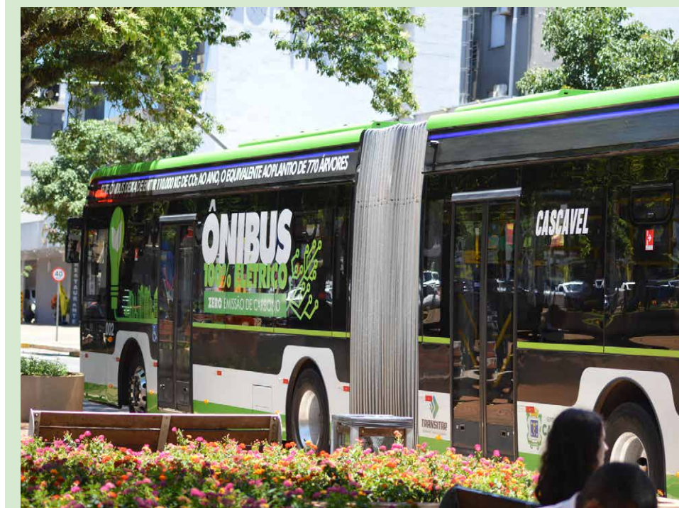
Sobre a esperada licitação do transporte coletivo não há novidades, nem edital; nova prorrogação já está no radar

Folador explicou ainda que o último prazo vencido em novembro do ano passado, quando o contrato foi cancelado, abrindo caminho para o novo processo. A obra é financiada pela Caixa Econômica Federal, com recursos do FGTS e contrapartida de 5% do Município, incluindo toda a infraestrutura necessária, como base, calçada e rampas de acesso.