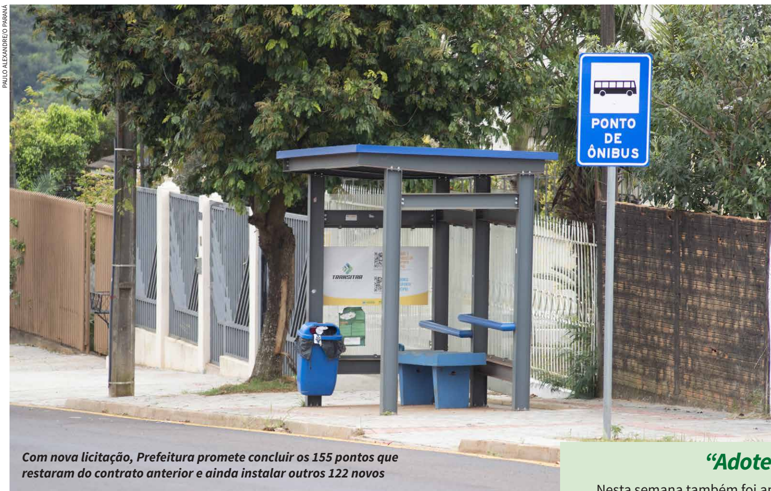
Com nova licitação, Prefeitura promete concluir os 155 pontos que restaram do contrato anterior e ainda instalar outros 122 novos

Folador, que literalmente “bateu na mesa” e prometeu resolver a situação — algo que o público já ouviu em capítulos anteriores — afirmou que, além de concluir os pontos pendentes desde 2020, a intenção é ampliar a rede de abrigos. Afinal, entre sol escaldante e chuva inesperada, o mínimo que o passageiro espera é um abrigo decente.