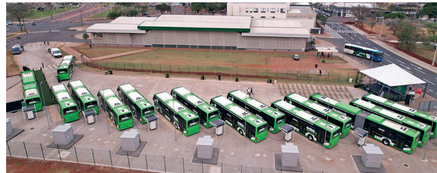
No transporte coletivo, que recebeu investimentos milionários em ônibus elétricos, ainda não há previsão de licitação; o serviço também segue com contrato provisório

Novo edital foi lançado para dezembro de 2024, mas novamente o