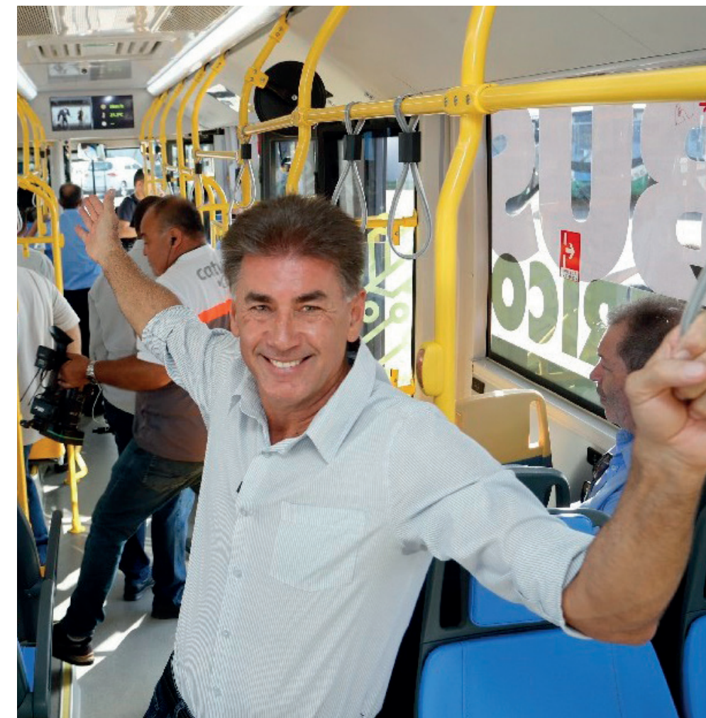
O ex-prefeito Paranhos encerrou seus oito anos de mandato sem conseguir realizar as duas licitações mais importantes do município, mesmo após contratar a FIPE.

Os dois contratos com a FIPE foram firmados na gestão Paranhos por inexigibilidade de licitação. O problema, em si, não está necessariamente na forma de contratação. A questão está no que veio depois — ou, talvez mais