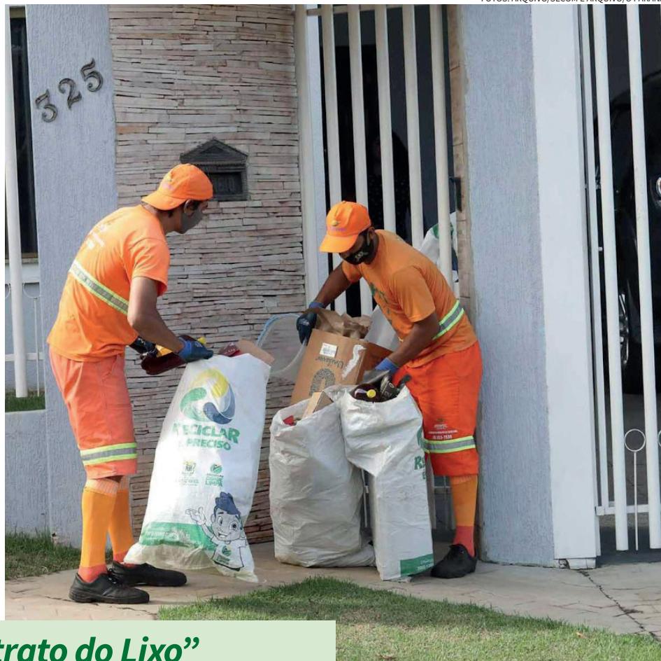
Serviço de coleta de lixo segue com contrato provisório, mas já tem data para nova licitação, com edital diferente do que foi sugerido nos “estudos” da FIPE

precisa gerar resultados concretos. Neste caso, os valores investidos na contratação da FIPE, não parecem ter gerado benefício ao município”, resumiu o vereador.