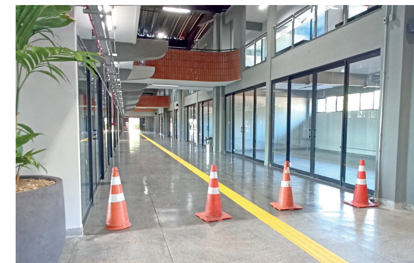
A obra não foi 100% concluída e algumas áreas continuam interditadas

O prédio possui dois andares, 32 plataformas de embarque e desembarque e recebe cerca de 11 mil ônibus por mês. O projeto manteve o padrão externo, com mudanças no layout interno, guichês, salas comerciais, terminal de encomendas, sanitários, catracas, acessibilidade, esquadrias, sistema elétrico e estacionamento.