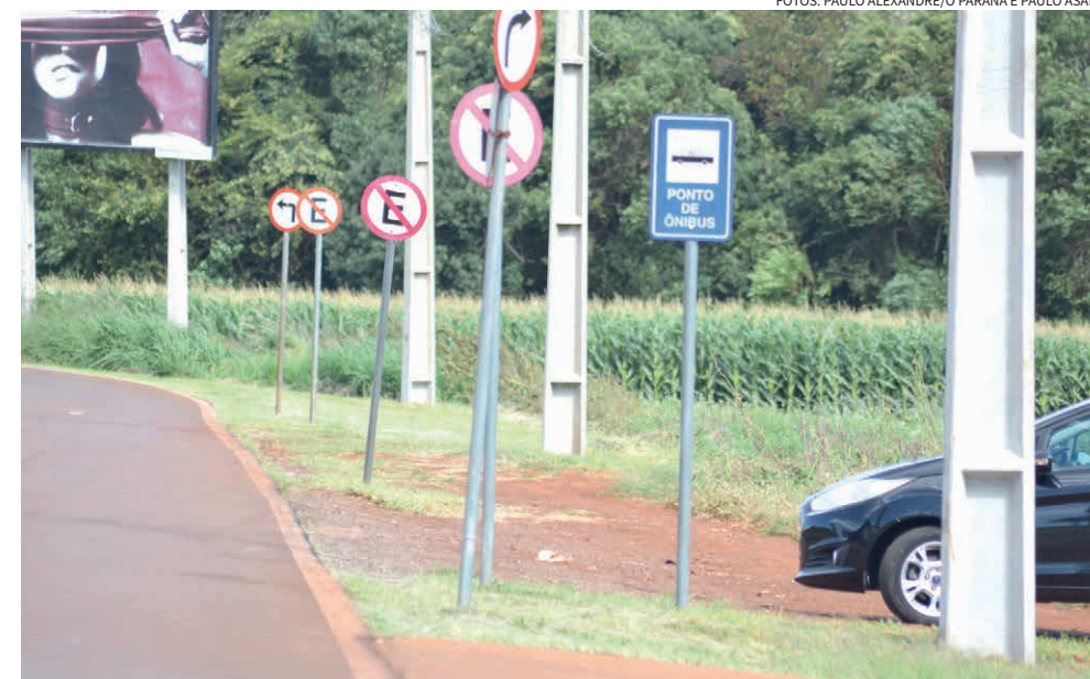
Na foto, o conhecido, alternativo e arriscado estacionamento ao lado da via de acesso ao terminal

A sensação de muitos usuários é de que o aeroporto deixou de ser espaço de acolhimento para virar um grande “drive-thru da pressa”. Pegou o passageiro? Sai correndo. Não encontrou? Dá mais uma volta no quarteirão e reza para não cruzar com a patrulha.