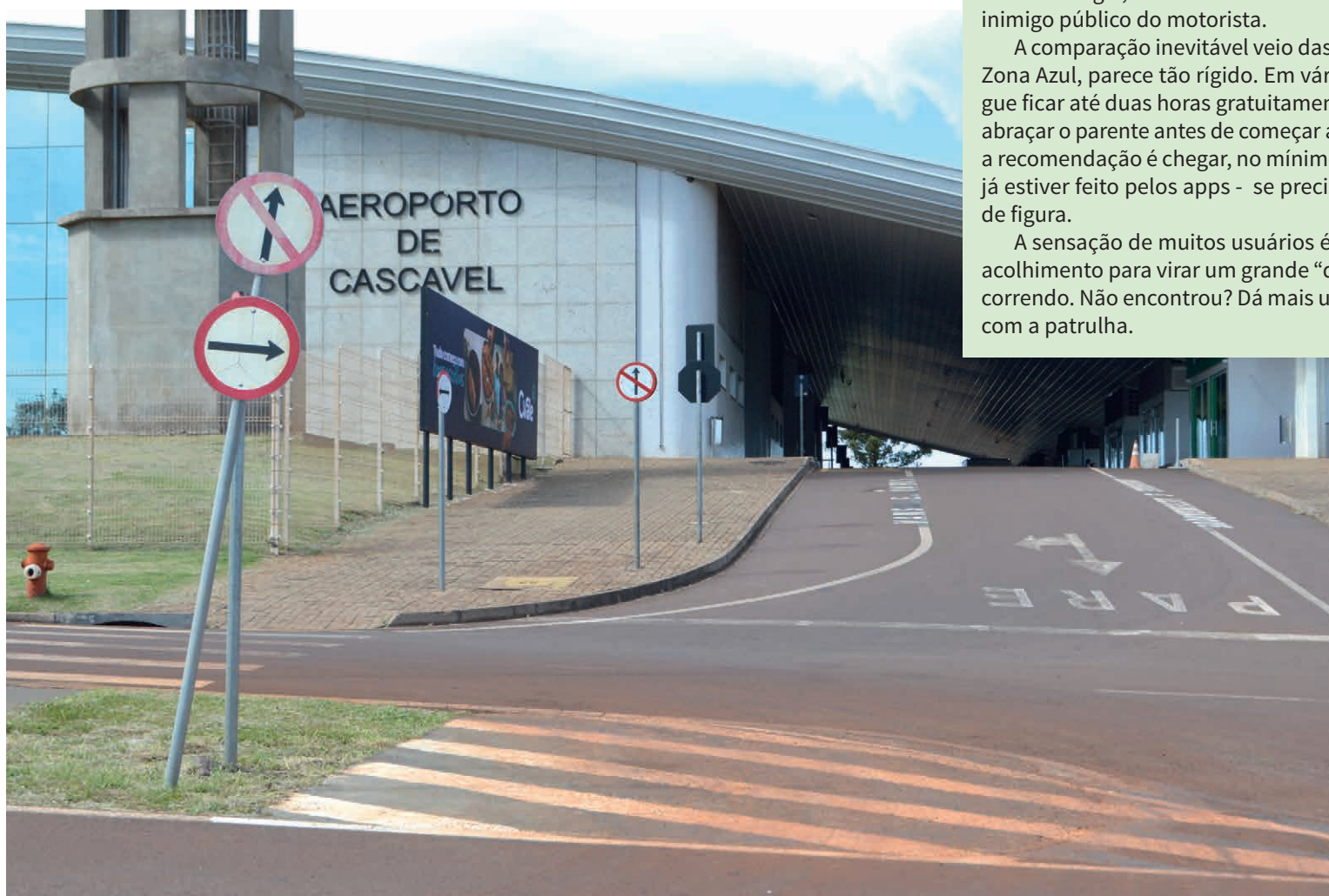
Não prestar atenção na sinalização e passar sobre as “faixas” já cobertas pelas marcas de pneus sujos de barro vai render multa de R$ 880,00