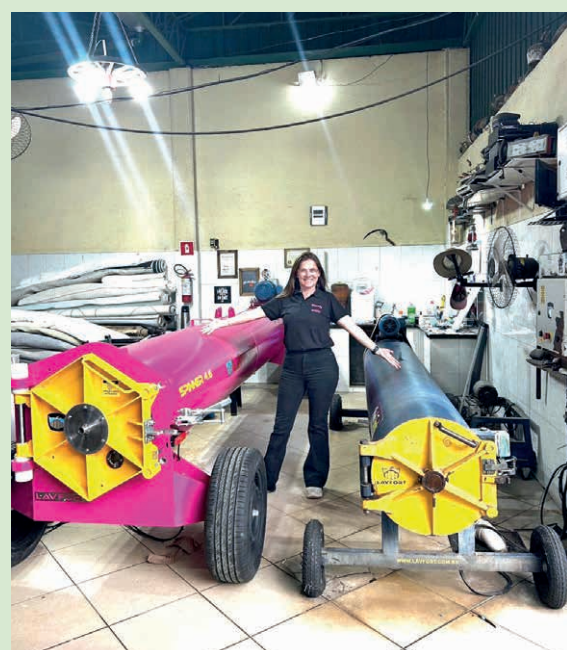
Se lavar tapetes sempre foi uma tarefa árdua em casa, a lavanderia especializada faz a alegria de quem não tem tempo ou paciência para a tarefa

Ela acredita que o crescimento do negócio está ligado justamente à praticidade. "Nossa equipe é pequena, mas o cliente volta porque percebe diferença. E convenhamos: ninguém sente saudade de esfregar tapete pesado em casa", brincou.