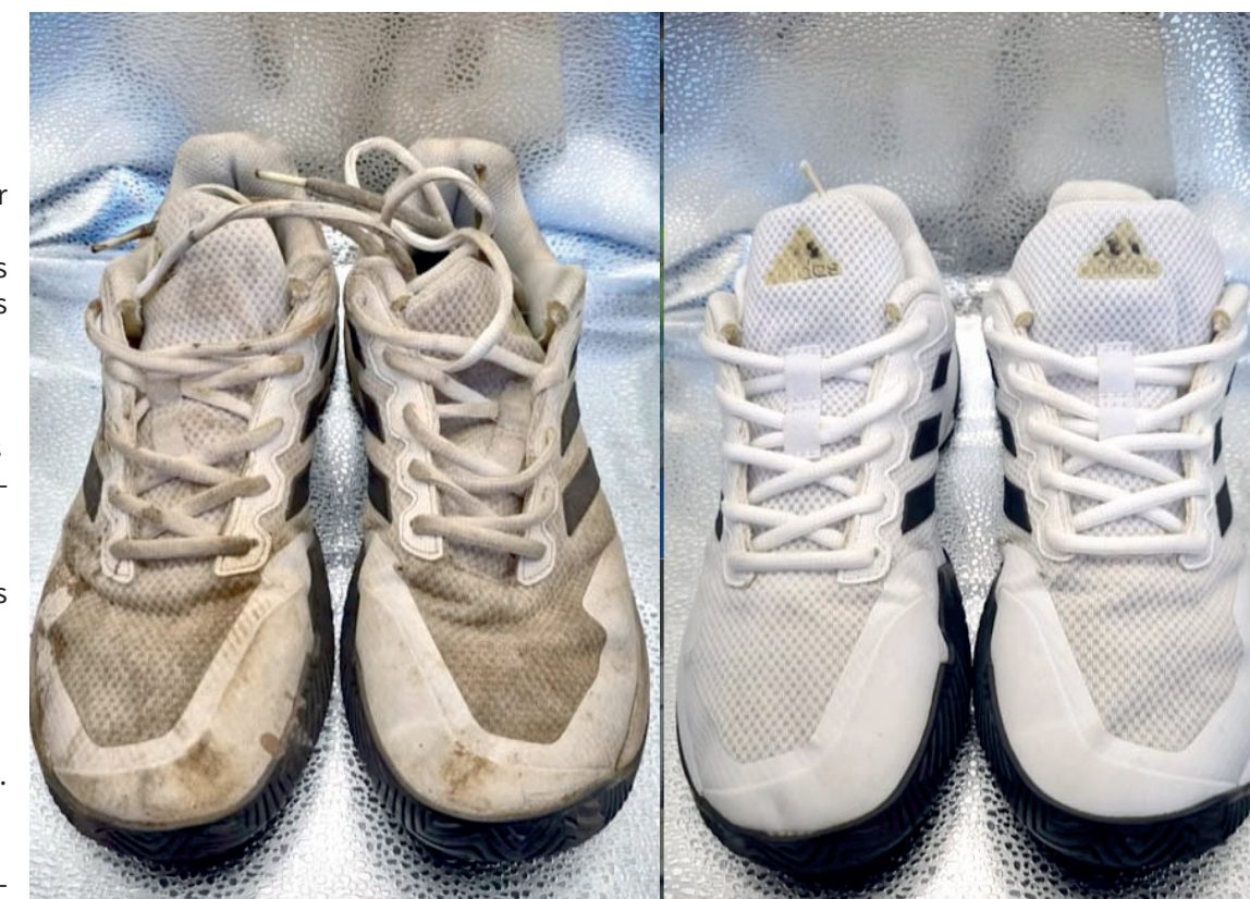
E para quem não acreditava em "milagres", a lavanderia de tênis é a nova queridinha de Cascavel: o "tênis condenado" volta à vida útil rapidinho

Para quem vive no piloto automático, a praticidade pesa. Em vez de perder horas tentando recuperar um tênis em casa, basta deixar na lavanderia e buscar pronto depois.