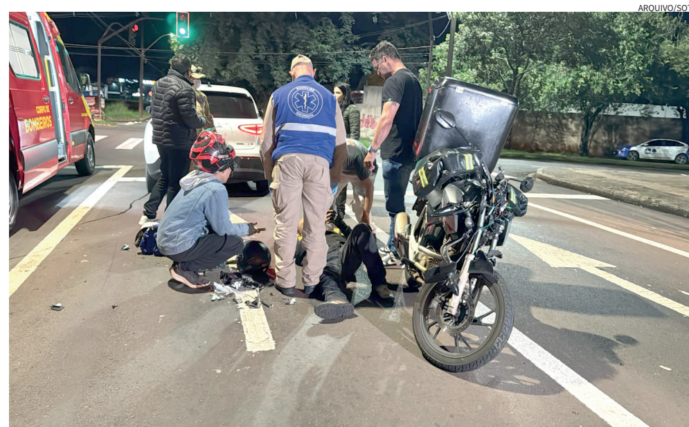
Acidentes deixam sequelas, abreviam vidas e deixam prejuízo que afetam toda sociedade

motorista, de motociclista a caminhoneiro. Mais do que um dever individual, o trânsito seguro é uma responsabilidade coletiva. Respeitar limites de velocidade, evitar o uso do celular ao volante, não dirigir sob efeito de álcool e ter atenção constante não são apenas obrigações legais, mas atitudes capazes de salvar vidas e evitar o colapso nos atendimentos de saúde.