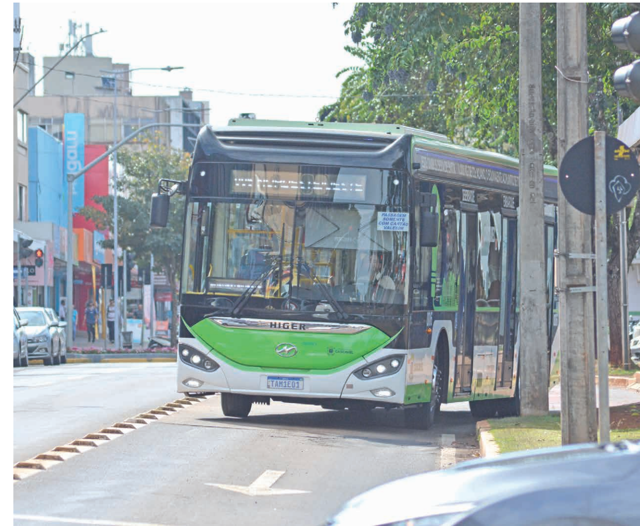
Ações do Maio Amarelo reforçam a importância do respeito à sinalização e da conscientização para reduzir acidentes no trânsito