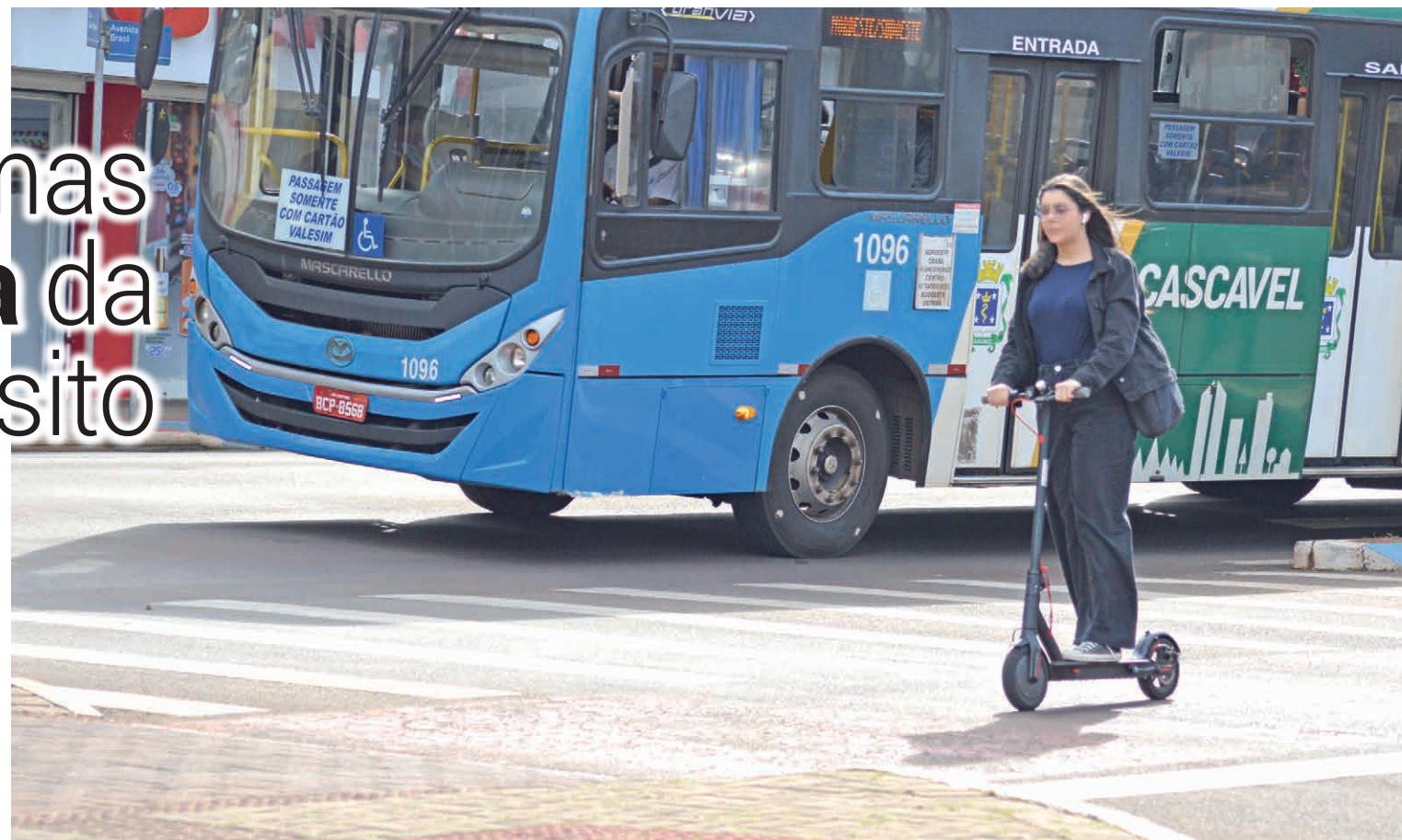
Cada um na sua faixa é sinônimo de tranquilidade e segurança no trânsito

Neste ano, os números continuam altos. Apenas nos quatro primeiros meses já foram contabilizados 93 acidentes, sendo 41 envolvendo ônibus da Viação Capital do Oeste e 52 da Pioneira.