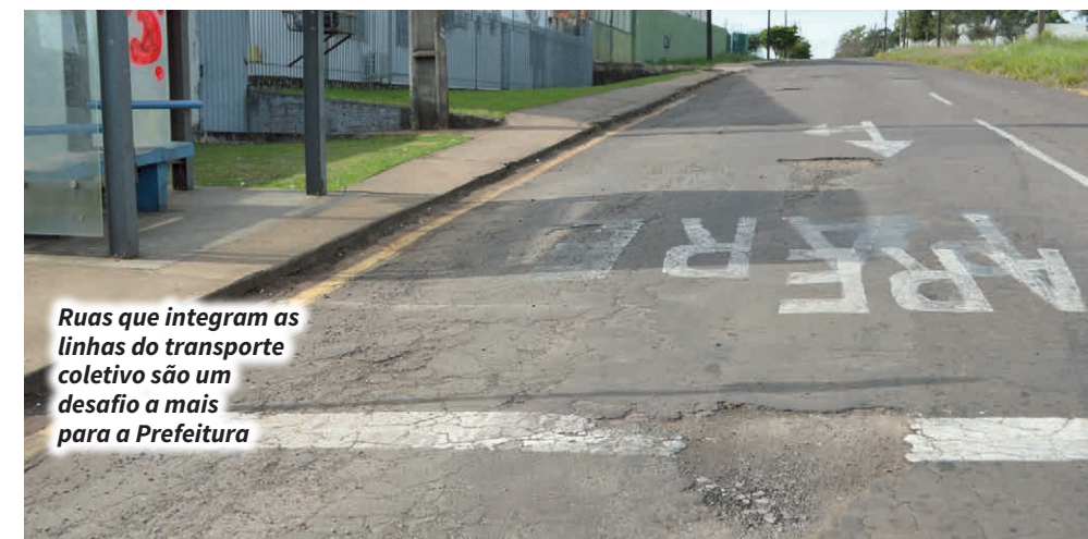
Ruas que integram as linhas do transporte coletivo são um desafio a mais para a Prefeitura

E a resposta passa por uma constatação simples: nem todo problema no asfalto é igual. O que a população costuma chamar genericamente de “buraco” pode significar desde pequenas fissuras até falhas estruturais profundas. Assim como na saúde, cada doença exige um diagnóstico e um tratamento diferente. E é justamente essa lógica que está guiando os investimentos da Prefeitura.