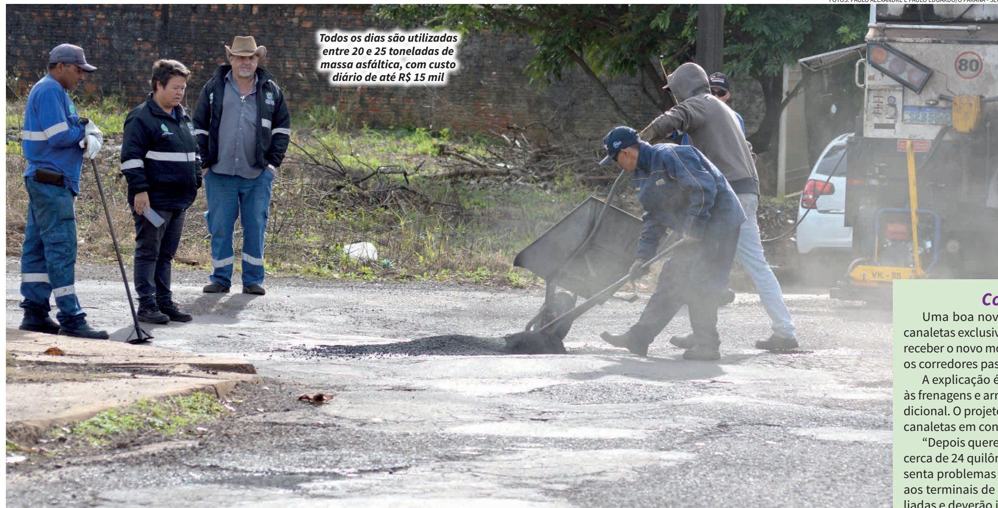
Todos os dias são utilizadas entre 20 e 25 toneladas de massa asfáltica, com custo diário de até R$ 15 mil

A missão não é simples. Como define o próprio secretário, muitas vezes o trabalho se parece com “enxugar gelo”. Resolve-se um problema em uma região enquanto outro aparece em um ponto diferente da cidade. É uma corrida permanente contra o tempo, o clima e o desgaste natural das vias.