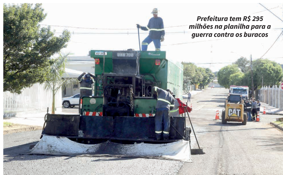
Prefeitura tem R$ 295 milhões na planilha para a guerra contra os buracos

Além das equipes da própria secretaria, empresas contratadas para outras obras também colaboram realizando melhorias nas vias próximas aos seus canteiros de trabalho. “É um trabalho contínuo. Não podemos parar porque ele reduz os impactos no dia a dia da população”, afirmou.